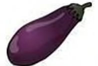
eggplant (AM) aubergine (BE)