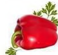
bell pepper (AE) sweet pepper (BE)