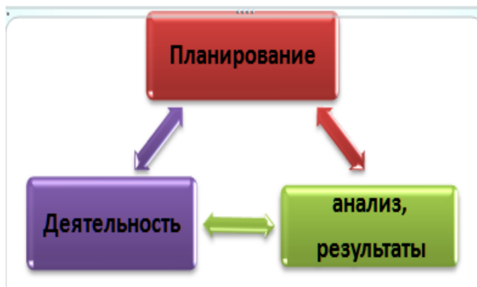
Схема 1 - Система контроля хода реализации Программы и результатов ее выполнения:

На каждый год необходима разработка плана воспитательной работы с обучающимися в целях обеспечения контроля хода и результатов выполнения плана работы (схема 2)